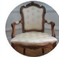
Fauteuil bois et tissu style Louis XVI

2° Les époques , le style artistique et les matériaux vont être différents, c'est le cas des meubles.