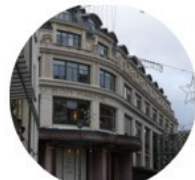
Le bon marché à Paris magasin créé en 1869