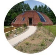
Maison dôme : rotative pour s'adapter à la position du soleil

2° Les époques , le style artistique et les matériaux vont être différents, c'est le cas des meubles.