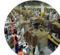
Entrepôts géants pour la vente en ligne