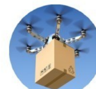
Les livraisons de colis par des drones

Les objets techniques évoluent en fonction des évènements historiques, des époques ainsi que du contexte social et économique .