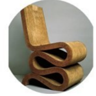
Fauteuil carton 1972 Franck Gehry

3° Le contexte social et économique. L'urbanisation, les transports et la production de masse ont permis la naissance et le développement des grands magasins, demain peut-être disparaîtront-ils au profit de l'achat en ligne et de la livraison par drones.