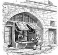
Echoppe du Moyen-Age

3° Le contexte social et économique. L'urbanisation, les transports et la production de masse ont permis la naissance et le développement des grands magasins, demain peut-être disparaîtront-ils au profit de l'achat en ligne et de la livraison par drones.