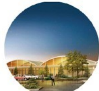
L'éco-construction, la Halle de Pantin, 2015