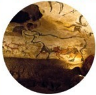
Habitat préhistorique : s'abriter

1° Des évènements historiques (Moyen-âge, Renaissance, guerres, paix, révolution industrielle...), c'est le cas de l'habitat par exemple.