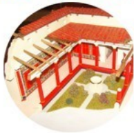
Villa romaine : se loger confortablement