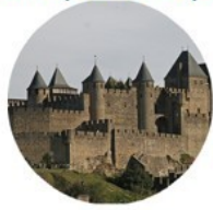
Citée fortifiée au Moyen-Age : se défendre